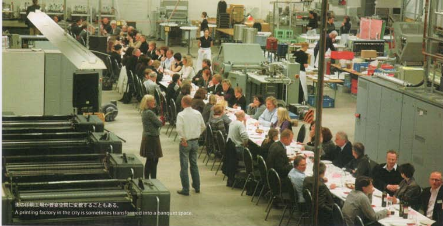
街の印刷工場が宴会空間に変貌することもある。 A printing factory in the city is sometimes transformed into a banquet space.