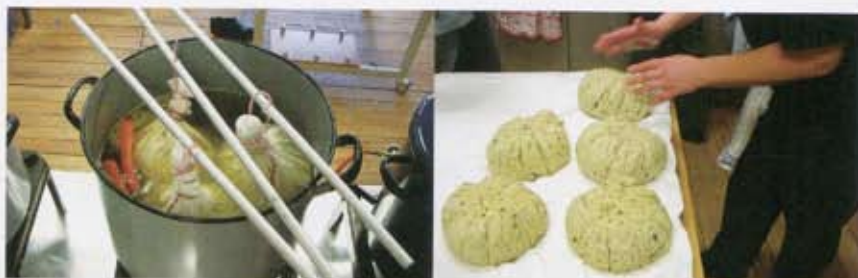
料理のアーキタイプ「混合微塵」に属する布に包んで茹で加熱成形するプディングの原理を学ぶ。 Learning the principle of pudding that belongs to the "blended and minced food" archetype. The pudding is wrapped in a cloth and given form through the application of heat.

かつてインダストリアルデザイン科の学生との芸術的造形ワークショップでラビオリをクリエイトする課題を出したとき、多くの学生はラビオリの造形をいかに個性的で他と違ったフォルムにするかに気を取られ、生地や具の量とのバランスなど全く考慮せずにアイロニーもエスプリもないラビオリのジョークをデザインしていたという。その失敗から、以後のワークショップでは、参加者にマテリアルを根本から考