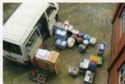
中古のワーゲンミニバスに食器、調理具、教材一式を積んでいざワークショップ先へ。 A complete set of tableware, cooking utensils, and materials are all packed inside a used Volkswagen van ready to head off to a workshop.