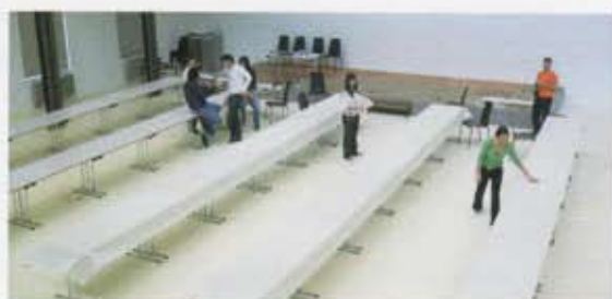
ワークショップの準備段階では会場の空間に合わせて、テーブルセッティングなどいろいろと試作を重ねる。 In the workshop planning stages, participants experiment with various table settings and other factors to match the venue space.

Gemengsel und Gehäcksel (a topography of blended and minced/mealed foods). This kind of cooking shows us the extent to which people in the 18th and 19th centuries cooked and ate every part of pigs and cows, and how they effectively recycled old bread and brought it to perfection in a different form.