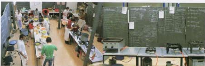
リヒテンシュタイン大学建築&空間計画研究所でのワークショップ「世界造形としての料理」風景。最後は学生15人が150人分のガストマールを準備。 Scene from "Cooking as Forming a World," a workshop at The University of Lichtenstein's Architecture & Planning Lab. Later, 15 students made preparations for a Gastmahl serving 150 people.