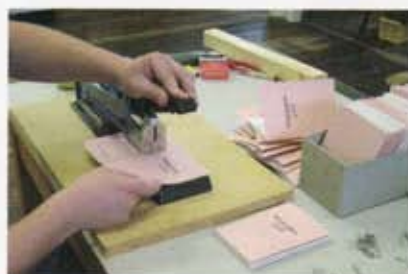
ガストマルのゲストに贈呈するための、メニュー解説の小冊子も手づくり。 The menu pamphlets presented to the guests at the Gastmahl are also hand-made.