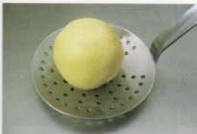
最もベーシックな料理の一つ、ジャガイモのゆで団子「クローズ」。 Klöße (boiled potato dumplings) is one of the most basic dishes.