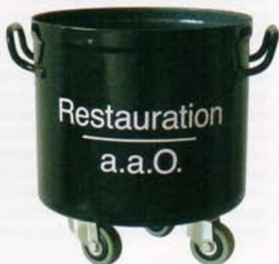
レストラツィオン a.a.O. のシンボルはローラー付きのホーロー鍋。 An enameled pot with rollers is the symbol of Restauration a.a.O.