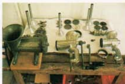
ワークショップで使われるミートチョッパー類。 Meat choppers used in the workshop.