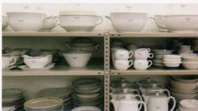
ワークショップで使う白い食器のコレクション。オリジナルロゴマークを焼き付けた。 Collection of white dinnerware used in the workshop. The original logo is printed on the collection.